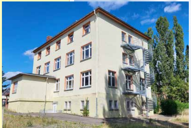
ehemaliges Schulgebäude Köbkestraße 11